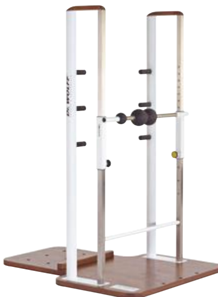
BACK & NECK 416