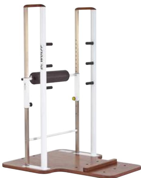
LAT & ARM 413